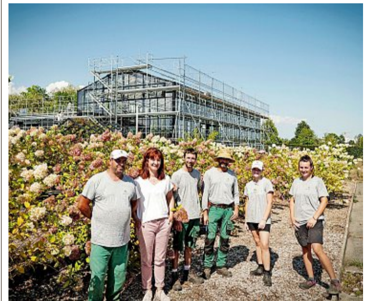
L'équipe pose devant la future serre. LAURENT GUIRAUD