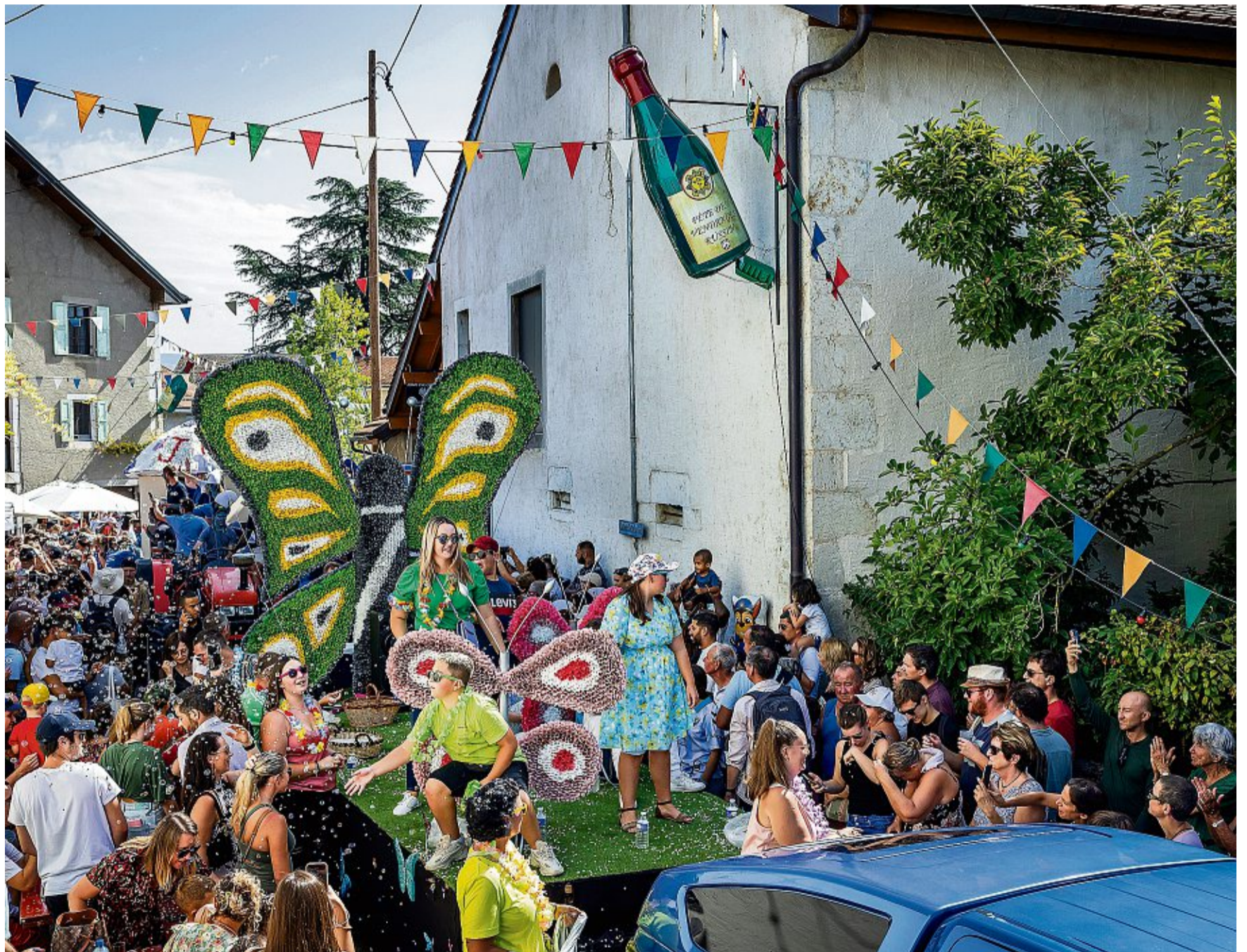
Le cortège de la Fête des vendanges en 2023. Pour 2024, le comité d'organisation change, mais la manifestation promet d'être aussi belle. MAGALI GIRARDIN

«Nous avons repris l'organisation au pied levé, mais nous pouvons compter sur des anciens pour nous épauler.»