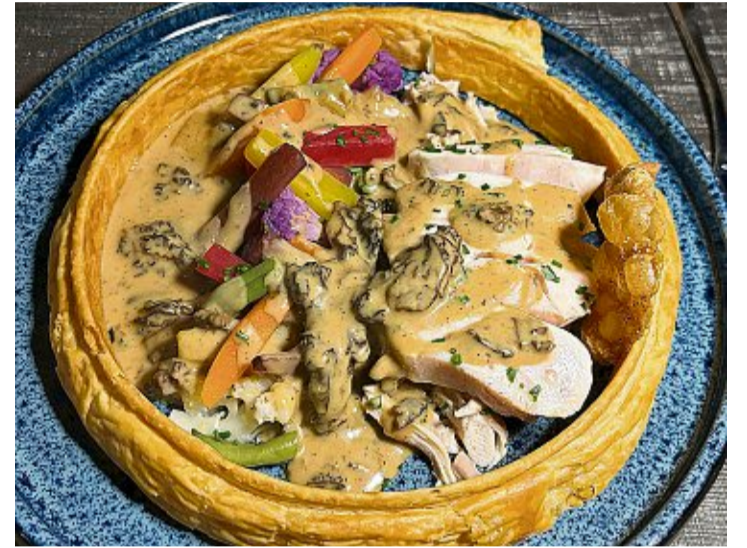
En haut, bonbon croustillant d'effiloché de bœuf. En bas, vol-au-vent de volaille aux morilles. LDD