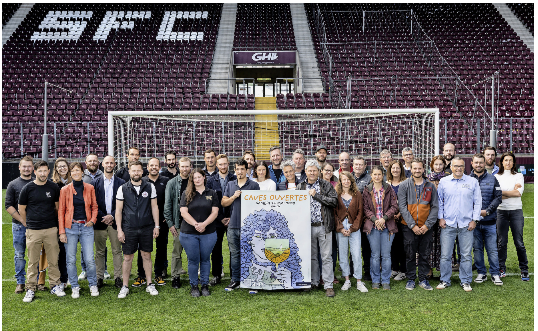
La présentation du Millésime 2024 avec les viticulteurs et viticultrices genevois au Stade de Genève, le 8 mai dernier.

Quels sont les dangers qui planent encore sur la vigne à ce stade? Il est encore possible d'avoir des épisodes de gel de printemps au mois de mai. Il faut donc prendre