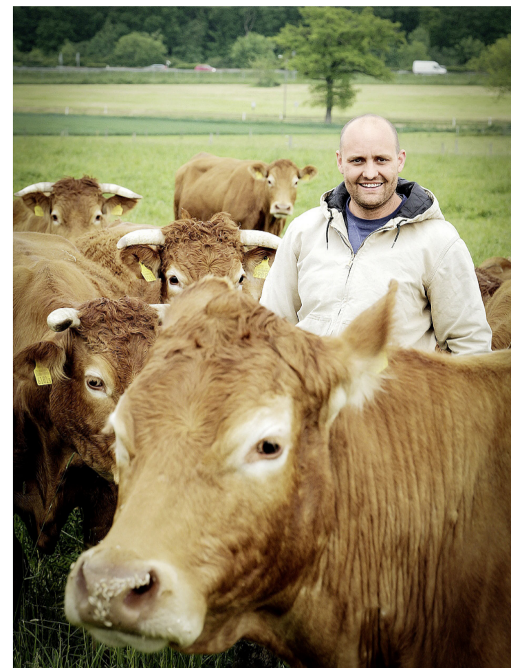
Magali Girardin/Pierre Alboury / Laurent Guiraud