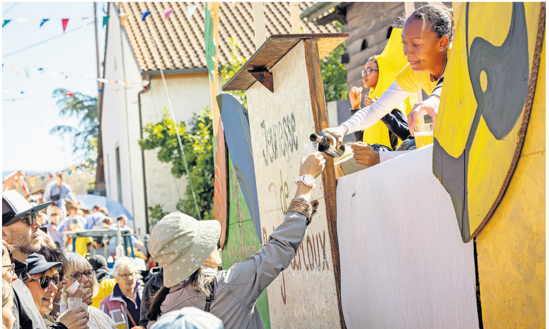
La Fête des vendanges de Russin, ici en 2024. Un rendez-vous que nombre de Genevois ne veulent pas rater.

Pour la deuxième année d'affilée, le comité d'organisation peut par ailleurs compter sur la participation de l'association ELLES Dardagny-Rus-