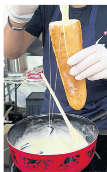
Le sandwich-fondue, à tester à Russin.

On le trouvera donc sur le stand des Laiteries Réunies, dans la cour de la ferme Pittet. Pour la dégustation immédiate, on pourra aussi jeter son dévolu sur des plateaux apéro, avec fromages et charcuterie.