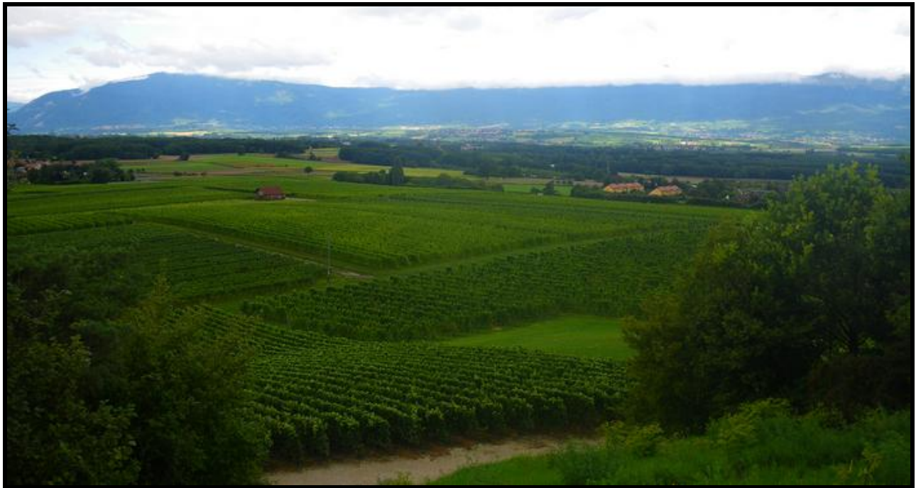
Vue sur le coteau de Bernex et le Jura

Au sommet de la colline, on peut aussi y trouver des tables d'orientation qui donnent des informations sur la campagne, la faune etc.