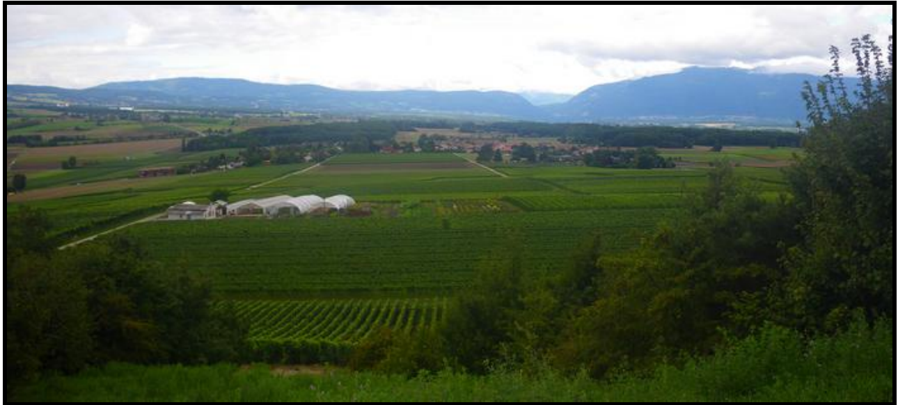
Vue sur la Champagne genevoise et le Vuache