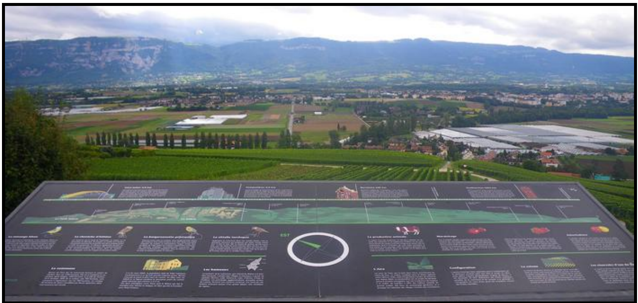
Les tables d'orientation